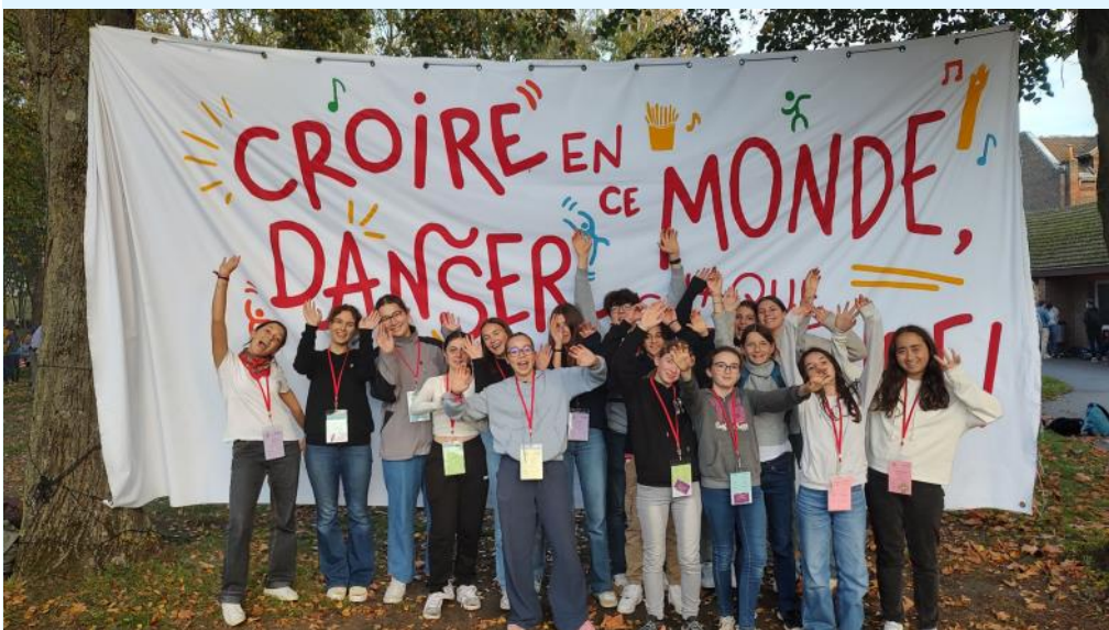
L'équipe service de l'aumônerie

"Danser avec des personnes atteintes de handicap"