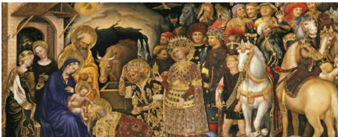
Adoration des mages par Gentile da Fabriano, 1423 - Musée des Offices, Florence