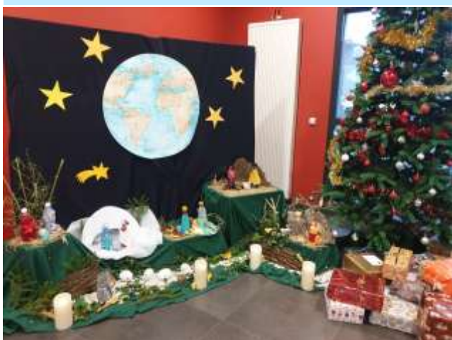
Crèche de l'ensemble scolaire François Gondin