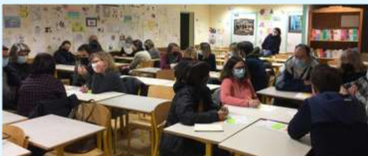
Temps d'échange entre parents

D'autres rencontres de ce type seront proposées à l'avenir. Nous vous informerons des thèmes et dates.